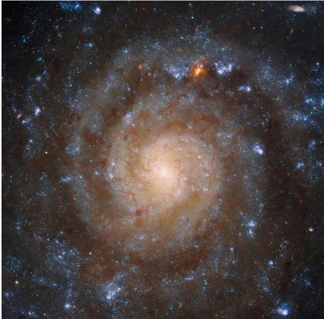
ハッブルの可視光・紫外線画像