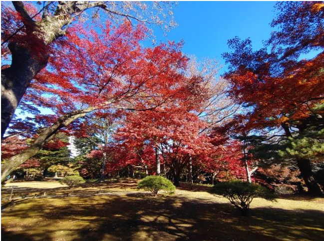
殿ヶ谷戸庭園（国分寺市）12/2

都内の遅れていた紅葉も12月に入り綺麗になりました。その分12月上旬まで長く楽しめ、全部は回り切れませんでしたが、日比谷公園と代々木公園、新宿御苑の紅葉を追加しました。