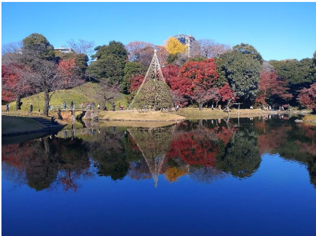
小石川後楽園（文京区）12/3