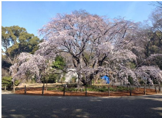
3月16日六義園 枝垂桜