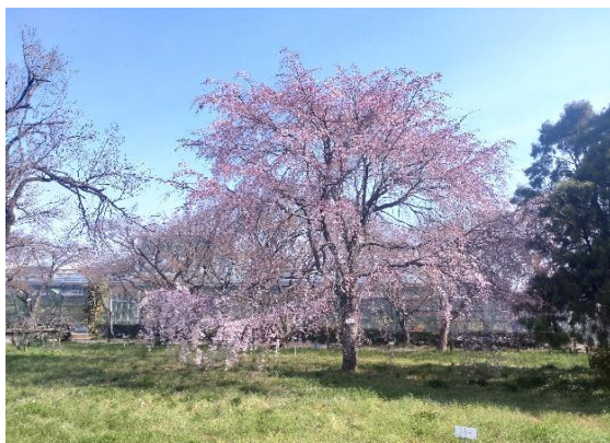
3月16日小石川植物園 枝垂桜