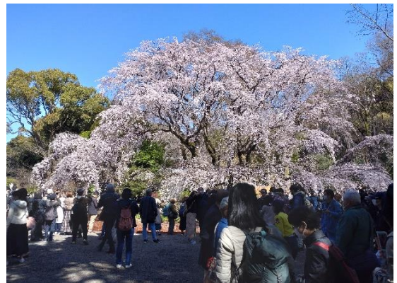
3月19日六義園 枝垂桜