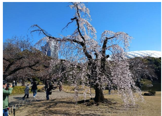
3月19日小石川後楽園 枝垂桜