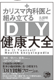
久保 明 著 晶文社 定価:1,600円+税